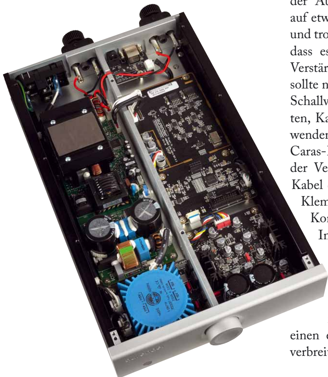
Die linke Gehäusehälfte ist komplett der ICEpower-Endstufe gewidmet, rechts sitzen Vorstufe und DAC-Board

Egal welches Quellgerät man denn nun verwenden möchte, alle Signale bahnen sich anschließend den Weg durch das Innere des Verstärkers. Zunächst einmal sorgt ein XMOS-Receiver-Chip für Ordnung im Datenchaos und fordert die nötigen Informationen