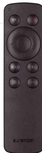
Wer einen Aurender-Server mit dem X725 verwendet hat fast keine Verwendung für die kleine Fernbedienung

Seite stufenweise eingestellt oder das Gerätstumm geschaltet werden. Die gleichen Bedienungsmöglichkeiten stehen einem auch bei Benutzung der kleinen Fernbedienung zur Verfügung. Sowohl Lautstärke und Stummschaltung funktionieren hier immer, den Eingang wechseln kann man jedoch damit nur, wenn ein Audioserver der Marke Aurender angeschlossen ist. Sollte das nicht der Fall sein, steht man vor einem kleinen Problem, denn Eingabeinstrumente zum Umschalten der Quelle finden sich am Gerät selbst keine. Eine etwas unverständliche Entscheidung, doch da der X725 so stark auf den X100 ausgelegt ist, ist sie zumindest nachvollziehbar, wenn auch nicht ganz praktisch. Die dritte Art, zumindest die Lautstärke zu kontrollieren, ist der große Drehregler in der Mitte der Gerätefront. Ebenfalls aus Aluminium, fühlt sich das Potenziometer gut an und hat einen ausgezeichneten Widerstand, so dass man beim Bedienen ein wunderbar analoges Gefühl hat. In einem kleinen Ring rund um den Regler herum ist ein Beleuchtungskranz eingefasst, dessen Farbe