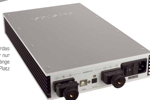
Die Lautsprecherklemmen von Cardas sind äußerst solide, lassen aber nur Gabelschuhe zu. Die beiden Eingänge finden zwischen den Klemmen Platz