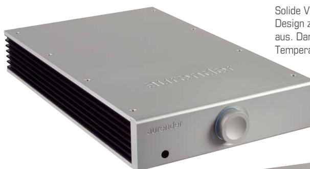
Solide Verarbeitung und minimalistisches Design zeichnen den langgezogenen Verstärker aus. Dank der großen Kühlrippen bleibt die Temperatur recht niedrig

den zurzeit anliegenden Eingang anzeigt. Bei weißer Beleuchtung wird der asynchrone USB-B-Eingang verwendet, erstrahlt der Knauf in grünlichem Licht, ist der optische S/PDIF-Eingang gerade in Betrieb. Weitere Anzeigen, die einem zum Beispiel Auskunft über die momentane Lautstärke oder eine aktivierte Stummschaltung geben, sind nicht vorhanden. Aber auch hier kommt erneut das Argument auf, dass